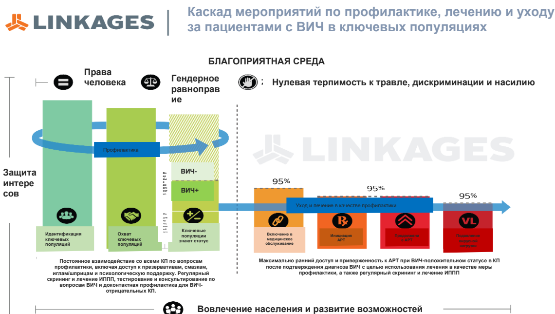
Рисунок 1. Каскад мероприятий по профилактике, лечению и уходу за пациентами с ВИЧ в проекте EpiC/LINKAGES

Данное объявление представляет собой запрос на выражение заинтересованности (ВЗ) местных общественных организаций (ОО) и организаций гражданского общества (ОГО) Таджикистана — именуемые в настоящем документе «ОГО» — для осуществления мероприятий, направленных на улучшение доступа ключевых популяций к качественным услугам по профилактике, лечению ВИЧ и уходу за пациентами с ВИЧ на протяжении 12-месячного периода с 1 октября 2021 г. по 30 сентября 2022 г. Посредством такого конкурентного процесса EpiC намеревается выбрать и предоставить грант на вовлечение населения и техническую помощь той ОГО Таджикистана, которое отвечает критериям, изложенным в настоящем документе. В Таджикистане проект EpiC внедряет активности используя непрерывный каскад услуг по профилактике, лечению ВИЧ и уходу за пациентами с ВИЧ (рисунок 1) в качестве общей стратегической основы реализации программы.